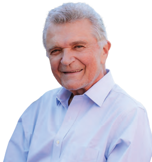
Manfred Swarovski Gründer

Das SWARCO CSR Playbook dient als umfassender Leitfaden für unsere CSR-Initiativen. Es bietet einen Fahrplan für die Integration von CSR in unser tägliches Geschäft, für die Entscheidungsfindung und die Förderung sinnvoller sozialer und ökologischer Auswirkungen bei gleichzeitiger Schaffung langfristiger Werte für alle Stakeholder.